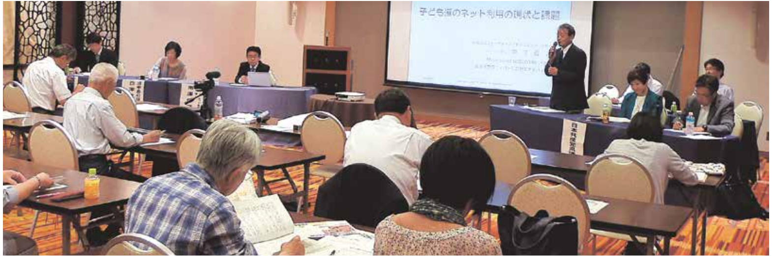
「子どもを性被害から守る取り組み—淫行処罰条例について—」 意見交換会 (5月15日・長野市)