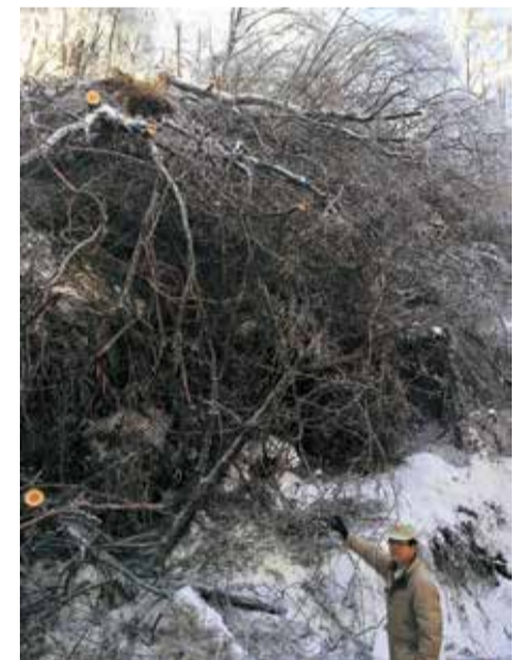
左上・地熱発電の給湯施設（大分県別府市） 左・雨水被書現場（松本市）