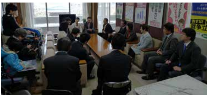
「中信地区の特別支援教育を考える会」の皆さんが要請のため来訪（2月17日）

また、任期途中で辞任をする教育長に対し、唐突で無責任の感が拭えないとの声があると所見を問いました。