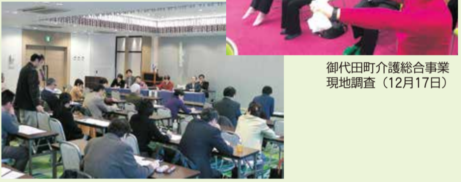
御代田町介護総合事業現地調査（12月17日）