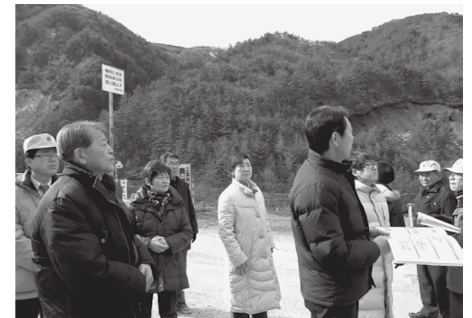
大鹿村を視察 左右に山崩れの跡が

リニアの開通に伴って現在の東海道新幹線は、運行本数が4分の1に削減される予定など、公共交通の利便性にも大きな疑問が持たれており、巨額な投資と環境破壊は時代に逆行する、リニアは中止すべきとの声も各地から上がりました。