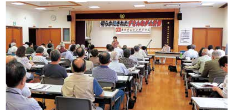
シンポジウムには毎回大勢の県民が参加 (6月14日開催)