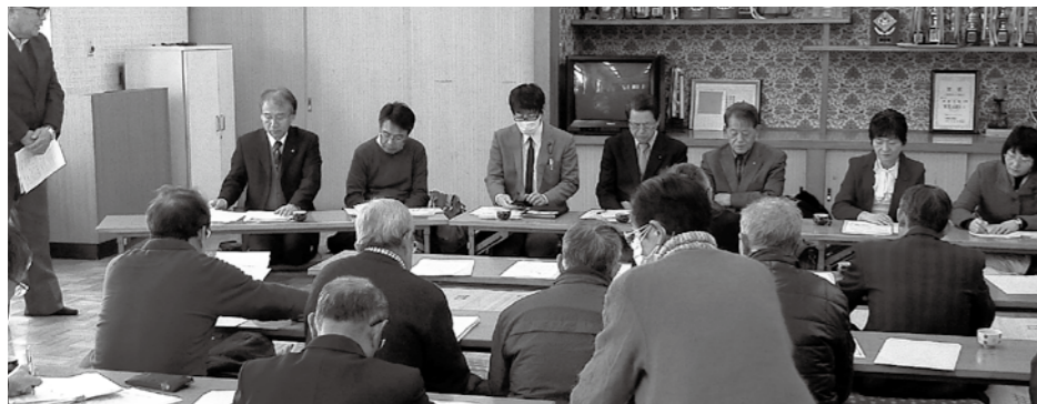
リニア駅予定地(飯田市上郷飯沼)の皆さんと懇談

南木曾町議会は5月、坑口の削減や住民説明会の開催などを、国土交通大臣に要望しました。