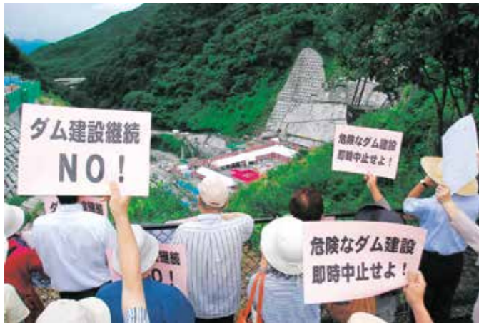
ダム定礎式への抗議 (2012年9月)

公共事業の見直しで一旦中止を決めた9つのダム計画のうち、県は8つの計画を中止しましたが、浅川ダムだけは造り続けています。